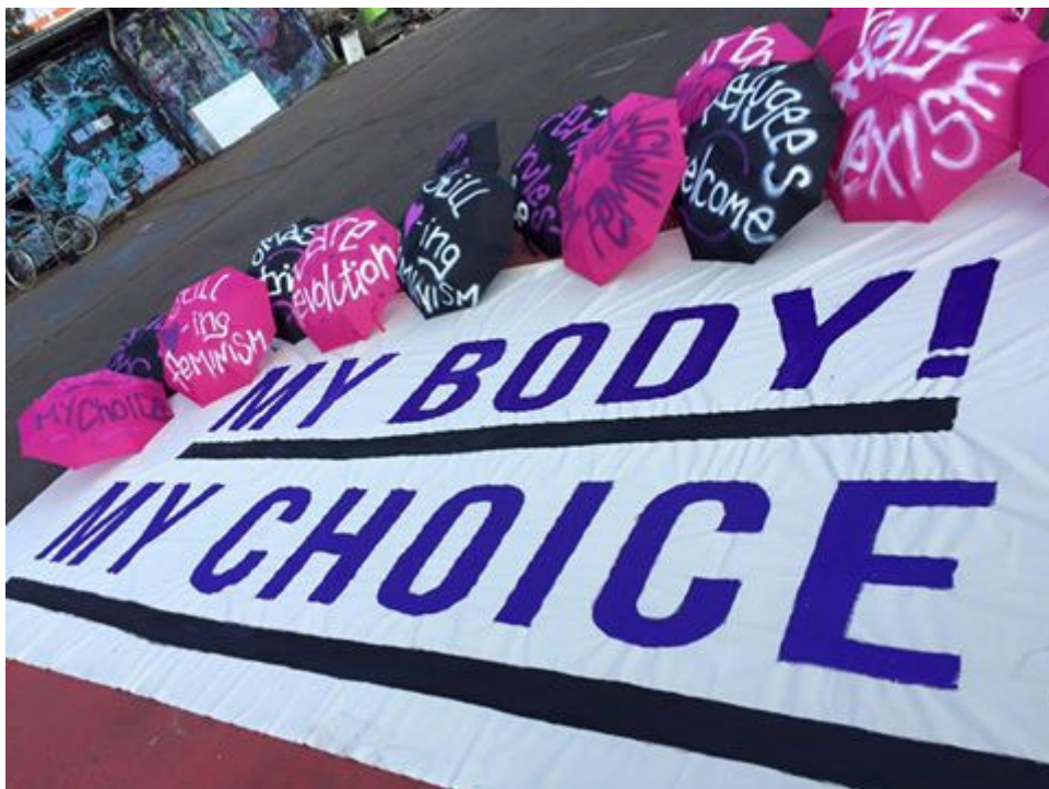
Die kreativen Vorbereitungen in Köln laufen auf Hochtouren

Dies Irae funktionierte kurzerhand die Frauen* verachtende Werbung des ADC – Art Directors Club für Deutschland zum Plakat für die Mobilisierung zur Demo um – eine feministische Adbusting-Antwort auf die Frauen* verachtende Werbung durch Überspitzung und Umfunktionierung als Mobil-Plakat.