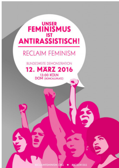
Offizielles Poster zur Demo

Im Anschluss der Demo werden entsprechend aktuelle Pressefotos dort ebenso zur Verfügung gestellt.